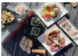
夜のお楽しみは SEASIDE BBQ