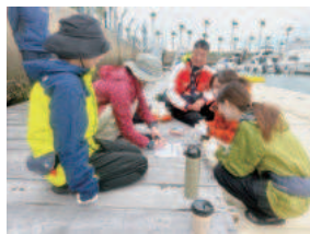
青空会議場！ 会議って部屋の中じゃなくても出来るもの。 自然の中だからリラックスして気軽に意見が言いあえるのかもしれない。