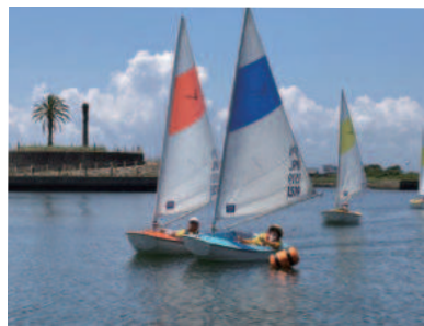
免許不要の小型ヨット（ハンザ）からスタート。港内で練習します。