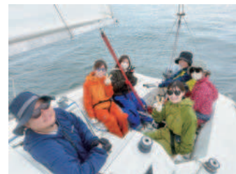
女性社員だけで参加された企業様 みなさん普段はインドア派！